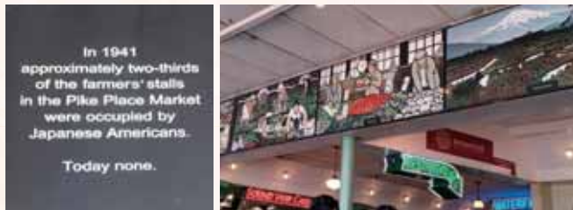
パイク・プレイス・マーケットにある パイク・プレイス・マーケット内の日系人の農家の絵メッセージ

それほど有名なパイク・プレイス・マーケットですが、1942年までここに多くの日系アメリカ人が店を出していたことを知る人はほとんどいないようです。それでも、マーケットの奥に入っていくと、次のようなメッセージが掲げられているのを見ることができます。