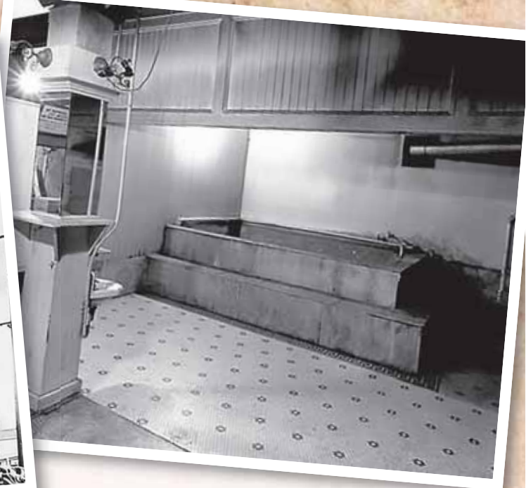
戦前のパナマホテルの地下共同風呂

1950年に閉鎖されてからは長い間忘れ去られていましたが、この地下には、日系人37家族が収容所に送られる直前、持ち物の一部、家族にとってあまりに大切で処分できないもの（ウェディングドレスや家族の写真など）を隠していたのです。