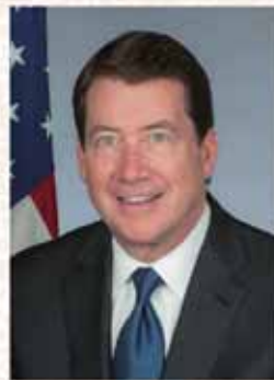
駐日米国大使 ウィリアム・F・ハガティ

William F. Hagerty, IV, Ambassador, Embassy of United States of America