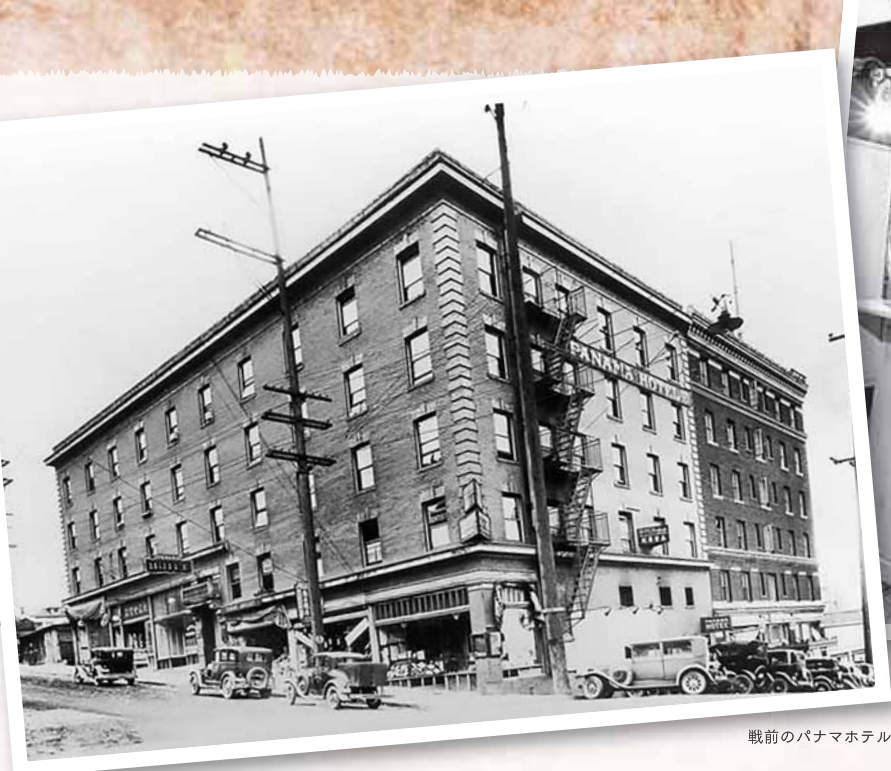
戦前のパナマホテル