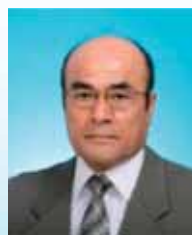
糸満市ジョン万次郎 上陸之地記念碑 建立期成会 理事

琉球を足掛かりに世界に開けた日本にすべく「ジョン万次郎」は無事に帰国を果たし、万次郎がアメリカで学んだ学問や技術はその後の日本にとって重要なものばかりでした。それを惜しげもなく日本の建国に尽力し活躍したのが後の「中濱万次郎」という当時の日本が最も必要とした男になります。