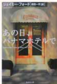
あの日、パナマホテルで

今年の日米草の根交流サミット大会に参加される方には、ぜひ「あの日、パナマホテルで」というジェイミー・フォード著の小説を読んでもらいたいと思います。1986年に、このパナマホテルの地下から、そうした日系人達の所持品が発見されたことから始まる小説で、1986年と1942年とを行きつ戻りつしながら話が進みます。フィクションですが、地理的・歴史的・文化的な背景はノンフィクション。12歳の中国系アメリカ人の少年ヘンリーと、同級生の日系アメリカ人ケイコの初恋は、人種差別や文化の摩擦、そして大統領令という障壁に阻まれます。アメリカでは100万冊を超えるベストセラーとなったこの小説の原題は、「Hotel on the Corner of Bitter and Sweet (スイート通りとビター通りの角に建つホテル)」。賑やかだった頃の日本町、ジャズクラブ、そして収容所の様子も、映画を見るかのように鮮やかに描かれています。シアトルのインターナショナル・ディストリクトの地図を広げながら読むと、あたかも自分もそこに入り込んだかのような感覚に襲われることでしょう。