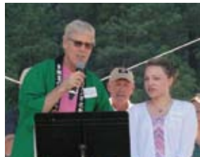
キーパーソンへの感謝状贈呈