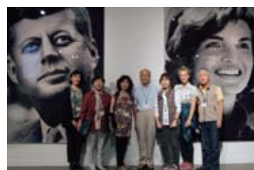
ダラス・フォートワース