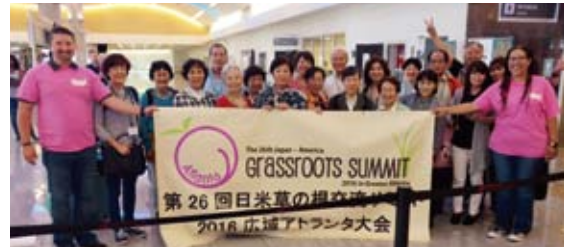
アトランタ空港でボランティアに迎えられた参加者

日本からの参加者は、直行便、シアトル経由便、ミネアポリス経由便に分かれて、ハーツフィールド・ジャクソン・アトランタ国際空港に夕刻到着。空港では、共催団体であるジョージア日米協会の大勢のボランティアが笑顔でお迎えくださいました。