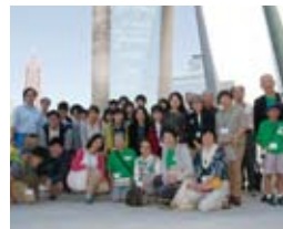
人権センターにて