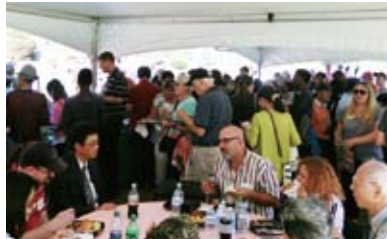
パーティーの様子