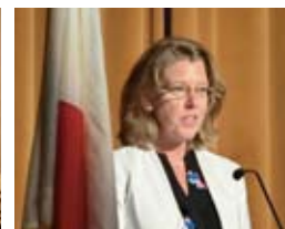
スザンヌ・パスアラ 米日カウンシル副会長