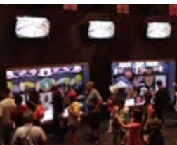
ワールド・オブ・コカ・コーラ見学

「名門会員制ゴルフクラブでプレー」コースには、松山英樹プロも参加したPGAチャンピオンシップが終了したばかりのイースト・レイク・ゴルフ場で、日本からの7名の参加者が、ジョージア日米協会の会員の方々と共にプレーを楽しみました。