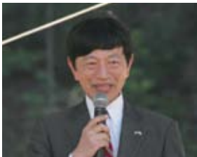
篠塚隆 在アトランタ日本総領事