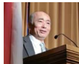
佐々江賢一郎 駐米日本大使