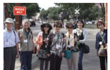
ダラス・フォートワース