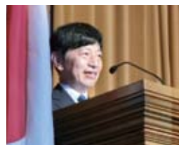
篠塚隆 在アトランタ日本総領事