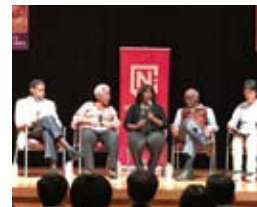
キング牧師子孫による証言