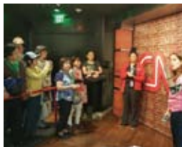
CNNセンターでスタジオ見学