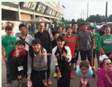
葛尾中学校生徒とミルトン高校の生徒達