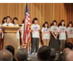
大分上野丘高校化学部生徒による自己紹介