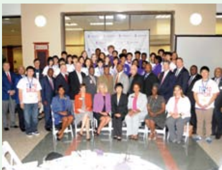
上野丘高校生徒とメーコンの高校生

また、両中学校の教員向けには、ニューナン市およびピーチツリー・シティーで教員向けプログラムを実施。小中高の授業の見学を通し、日本との教育現場との違いや類似点を発見してもらうとともに、現地の教育関係者とのディスカッションでは、教育のあり方について熱心に討議していただきました。