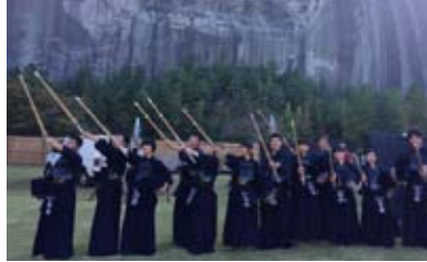
葛尾中学生による剣道演武