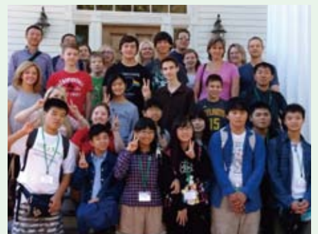
川内中学校生徒とエルキンス・ポイント中学校の生徒達