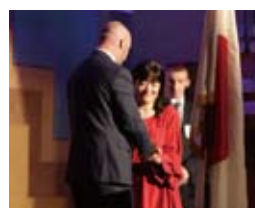
中濱家とホイットフィールド家 による地球儀交換