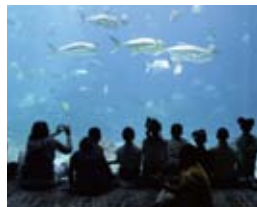
ジョージア水族館見学