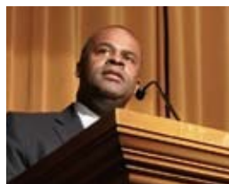
カシム・リード アトランタ市長