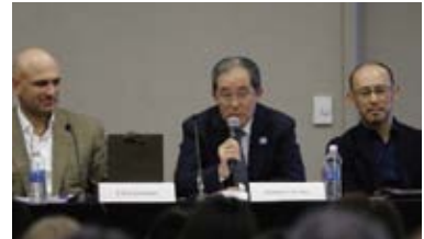
パネリストとしてシンポジウムにも参加