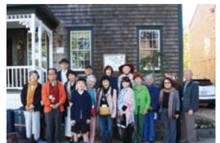
フェアハイブんとボストン