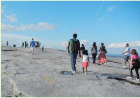
頂上へは徒歩または、ロープウェイで。