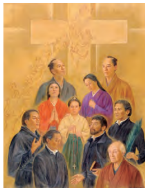
「ペトロ岐部と187殉教者」

https://ja.wikipedia.org/wiki/ペトロ岐部と187殉教者 https://www.cbj.catholic.jp/catholic/saintbeato/kibe187/