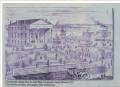
▲レキシントン・コンコードの戦い

マサチューセッツ州ボストン北西郊外の町。現在は、ミニットマン国立歴史公園などが歴史的な名所として知られている。