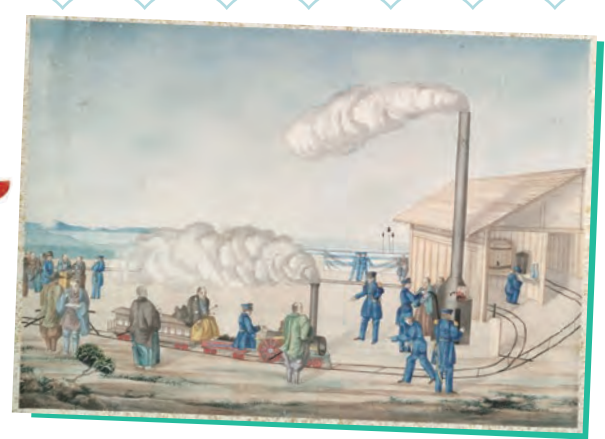
1854年3月13日、横浜の環状線路上を走るミニチュア蒸気機関車

この模型は、約250年に及ぶ鎖国によって技術的に立ち遅れている現実を印象づける狙いも持っていました。その効果は大きく、日本人に近代技術への強い関心呼び起こします。機関車はスプリング・ガーデン通りのノリス社で製造されましたが、