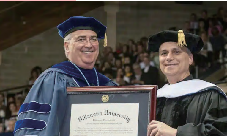
ビラノバ大学学長ピーター・M・ドンヒュー氏(左)が、2014年卒業式においてロバート・プレヴオスト司教(ローマ教皇レオ14世)に名誉博士号を授与した。 ©ビラノバ大学

https://en.wikipedia.org/wiki/Pope_Leo_XIV