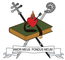
聖アウグスチヌス修道会の紋章

聖アウグスチヌス修道会は、4世紀の神学者・哲学者である聖アウグスチヌスの思想と霊性を基盤とするカトリック修道会です。共同生活、学び、奉仕を重視し、「信仰と理性の調和」を重要な価値として掲げてきました。