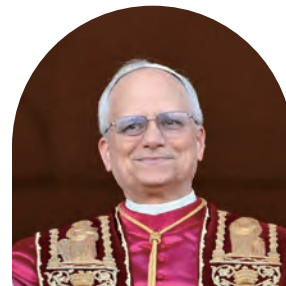
ローマ教皇レオ14世