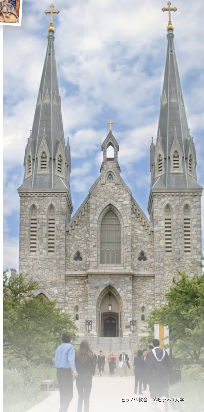
ピラノバ教会

参考： https://ja.wikipedia.org/wiki/聖アウグスチヌス修道会