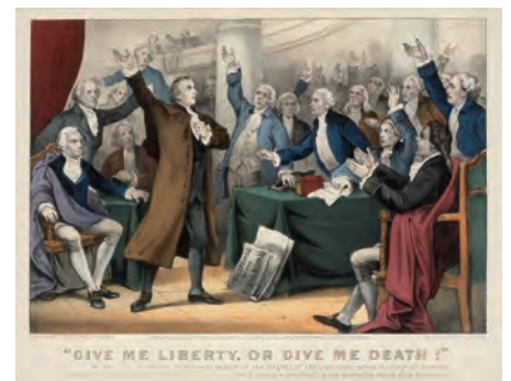
「自由を我に与えよ、さもなければ死を!」 —パトリック・ヘンリーがバージニア議会において植民地の権利を訴える偉大な演説を行う様子