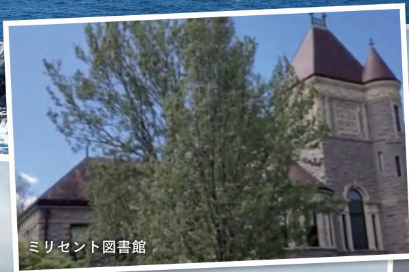
ミリセント図書館