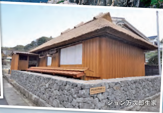
ジョン万次郎生家