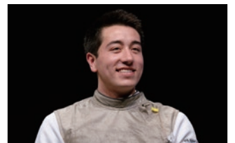
グレック・マインハルト選手

あれから10年の時が経ち、折しも1年延期になった東京オリンピック開催の準備がされています。昨年末、サミット大会のツアー担当として関わっている近畿日本ツーリストから、東京オリンピックのフェンシング・フルール競技(個人・団体)のアメリカ代表のグレック・マインハルト選手が、奇しくもサンフランシスコ出身、しかもLW高校出身であるという情報が届きました。マインハルト選手は2008年の北京オリンピックにアメリカのフルール選手最年少として出場し、東京オリンピックでオリンピック4回出場という実力と共に期待される選手です。3月10日(執筆中)現在、東京オリンピックの観戦形式の基準は不明ですが、開催時には是非応援をお願いします。東京オリンピックを身近に感じ、サミット大会に縁のある選手の応援という一味違う観戦を楽しんでください。