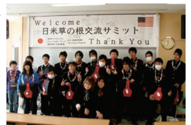
石巻商業高校で生徒とグループ写真

この新たなご縁をきっかけに、石巻市の高校生とサンフランシスコの高校生とのオンライン交流をはじめ、宮城大会とサンフランシスコ大会の参加者を中心としたオンライン同窓交流会等を予定しています。どうぞご参加ください。