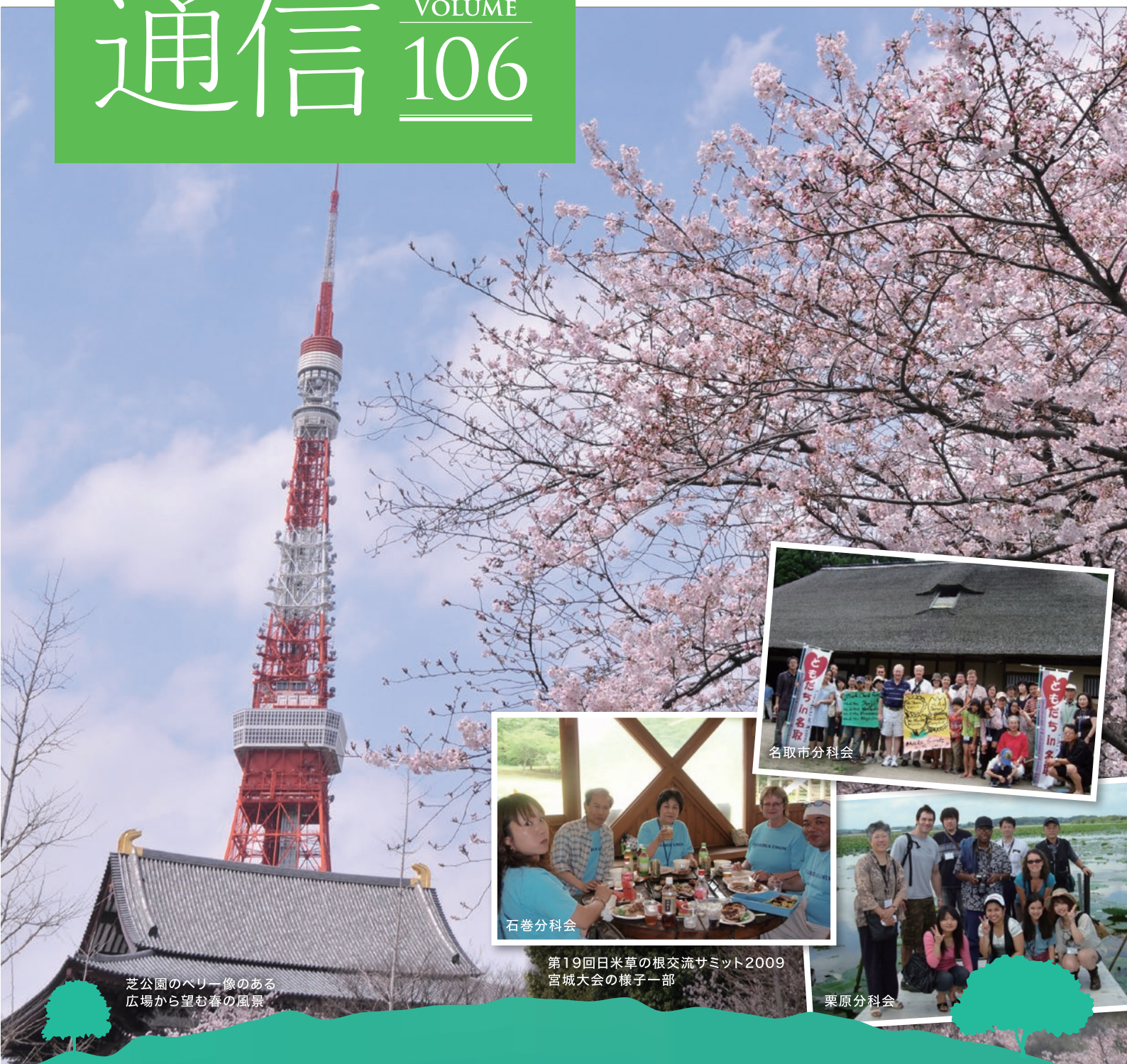
芝公園のペリー像のある 広場から望む春の風景