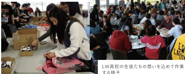
LW高校の生徒たちの想いを込めて作業する様子

早速、LW高校の生徒、教職員、ボランティアの保護者たちによって、支援のための募金活動から始まります。さらにはサンフランシスコ大会でのホストファミリーやその友人たちが集まり、折り鶴やメッセージ作りを手伝います。募金を知ったチャイナタウンのロータリークラブは、サンフランシスコ大地震の際、日本ロータリークラブから支援を受けたそのお返しとして、物資購入分の資金を援助してくれました。多くの手によって用意された心のこもったリュック500個をメグミ