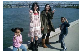
ホストファミリーと記念写真 With host family at Ohio river