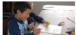
一緒に勉強 Learning together