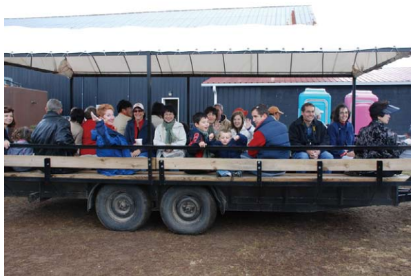
遊覧旅行へ Field trip