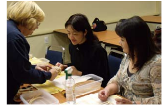
籠を制作中 Making baskets