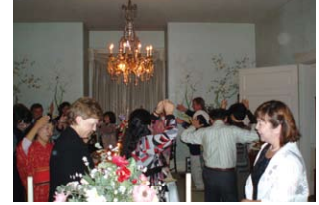
みんなで阿波踊り Japanese dancing "Awa-odori"