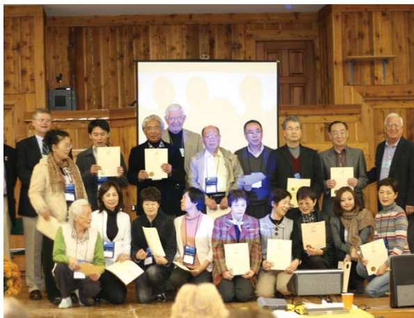
ウェルカムセレモニーで記念写真 With host families at the welcome party

Old Fort Harrod State Park excursion Tour of Shaker Village