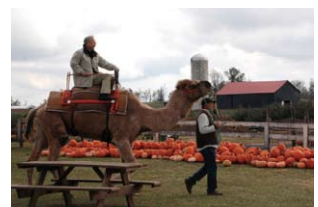
イベントを見学 Local attractions