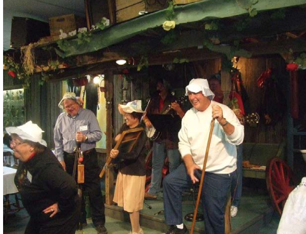
即興でパフォーマンスを披露 Enjoying a spontaneous performance

My Old Kentucky Home State Park Party at mayor's house