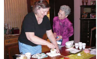
ホストファミリー宅で茶会 Tea ceremony with a host family