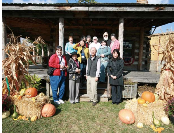
工芸家たちと記念写真 A commemorative photograph with handicraft artists

Welcome reception at Berea Quilting at Citizen's Art Center