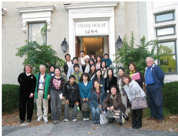
クレイン・ハウスで記念写真 Welcome reception held at Crane House

Welcome reception at Crane House Suzume Odori (a traditional Japanese dance) lesson at the art school