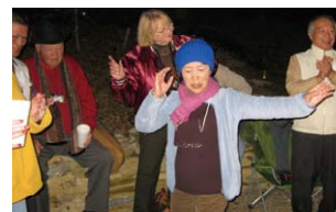
みんなでダンスパーティー Dance party