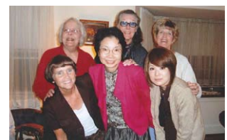
ホストファミリーと記念写真 A commemorative photograph with host families