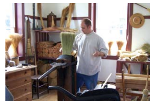
シェーカー・ビレッジのほうき作り Broom making at Shaker Village