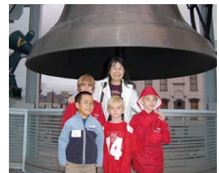
ワールド・ピース・ベルで記念写真 Posing in front of the World Peace Bell