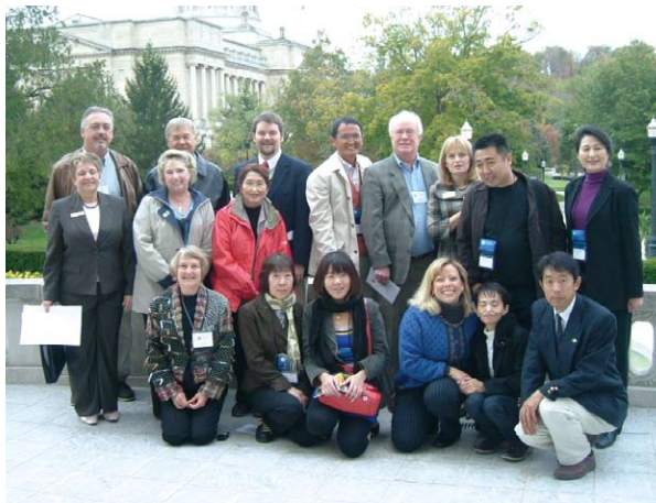
ホストファミリーとの集合写真 A commemorative photograph with host families

Breakfast at the Governor's House Buffalo Trail excursion