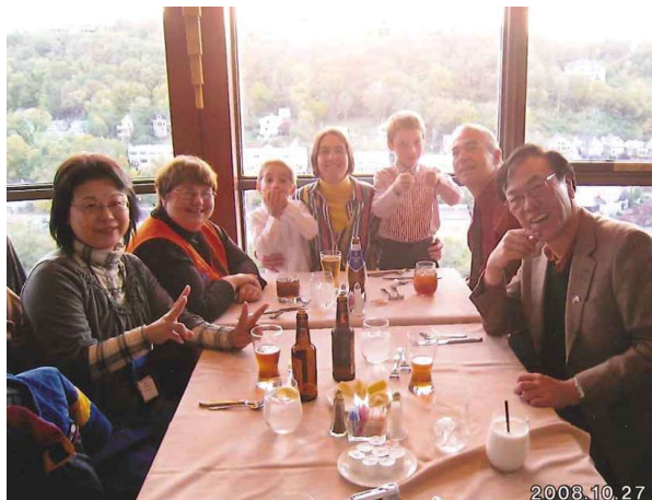
ホストファミリーと記念写真 Happy hour with a host family

Opening Ceremony performance by World Peace Bells Farewell meal at Hoffblow House