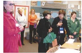
ダンビルの聾学校を訪問 A visit to a school for deaf people