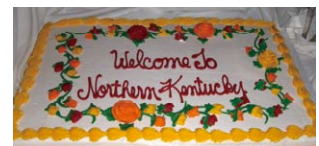
ウェルカムケーキ Commemorative cake at welcome party