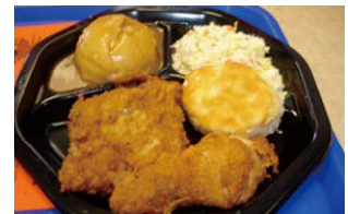
ケンタッキーフライドチキン Kentucky Fried Chicken