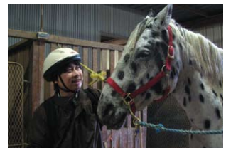
待望の馬とご対面 Finally meeting one of Kentucky horses