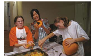
ハロウィンの準備中 Preparing for Halloween