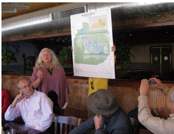
地元ボランティアによるケンタッキー州の説明 A volunteer introduces Kentucky

Tour and winetasting at Acres of Land Winery Tour of Fort Boonesborough State Park