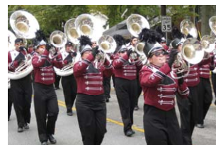
学園祭のパレード見学 Homecoming parade