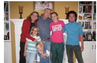
ホストファミリーと記念写真 A commemorative photograph with host families