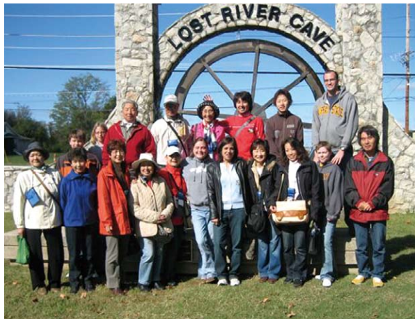
ロスト・リバー鍾乳洞で記念写真 Posing in front of Lost River Cave

Lost Rivercave excursion Luncheon hosted by City of Bowling Green