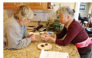
日本食について説明中 Introducing Japanese food