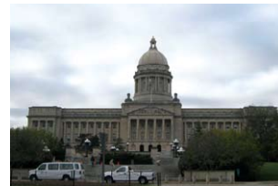
州議会堂 State building