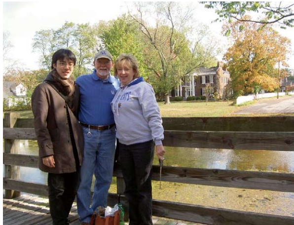
ホストファミリーと記念写真 A commemorative photograph with host families

Welcome party at Constitution Square Excursion to a bourbon factory