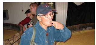
バーボンを味見 Tasting bourbon