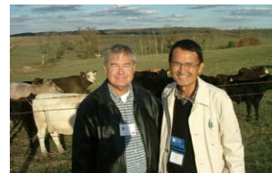
ホストファミリーと記念写真 With a host family