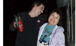
ハロウィンの衣装でびっくり Surprising Japanese guests with scary Halloween costumes