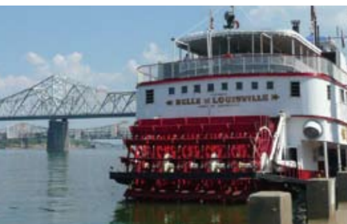
蒸気船「ベル(美人) オブ ルイビル」 Steamboat "Belle of Louisville"

Rolling hills and horse farms, historic Bourbon distilleries, steamboats, arts and crafts, delicious food, and warm people... Kentucky provides a perfect blend of American "heartland" experiences. It has been a melting pot of cultures and groups for several hundred years. Kentucky combines the hospitality of the South, the relaxed atmosphere of the West, and the business of the East coast. Kentucky has been the scene of many historical events, including Indian wars, Revolutionary War expeditions, start of Lewis and Clark expedition, Civil War battles and steamboat races, and is the location of many important sites, including Mammoth Cave, the US gold bullion at Fort Knox, bluegrass horse farms and majestic mountains. The 2008 Japan-America Grassroots Summit will be held in Autumn, a season of beautiful Fall colors and the excitement of horse racing in Kentucky.