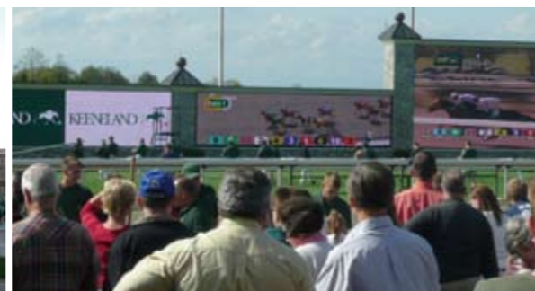
キーンランド競馬 Horse racing at Keeneland