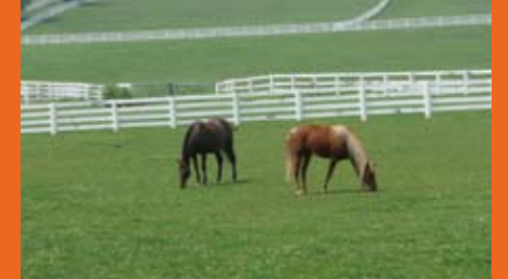
ブルーグラス牧場。 世界のサラブレッドの約3分の1がここで育ちます。 Horse farms dot the landscape in Kentucky. One third of all Thoroughbred horses in the world are bred here.

新着情報はwww.manjiro.or.jpにて随時発表。 and more... Access to www.manjiro.or.jp