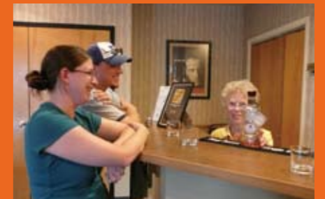
著名な醸造所を訪ね、バーボン街道ツアーを楽しむビジター Visitors enjoy many famous distilleries on the Bourbon Trail Tour