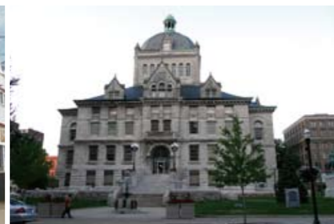
レキシントンの街角 Lexington