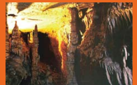
世界最長の長さを超える世界遺産の鍾乳洞「マンモスケイブ」 World heritage site: Mammoth Cave, is the longest recorded cave system in the world