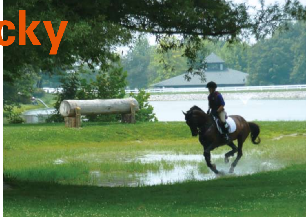
ホースパーク(レキシントン市) Horse Park in Lexington

日米草の根交流サミットケンタッキー大会 The 18th Japan-America Grassroots Summit 2008 in Kentucky