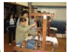
伝統的な織物体験 Traditional fabric making