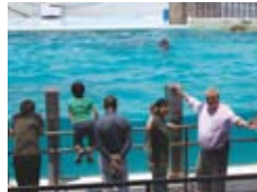
能登島水族館へ Notojima aquarium