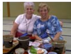
日本料理を楽しむ Enjoying Japanese dishes