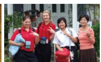
ホストファミリーとの記念写真 With a host family