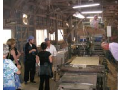
畳工場を見学 Visiting a tatami mat factory