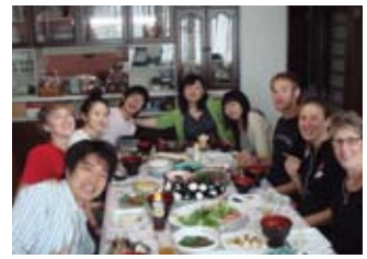
日本の朝食を食べる Enjoying a Japanese breakfast