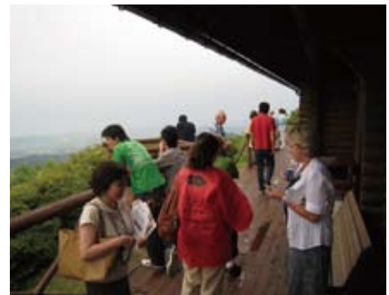
喜多家を見学 Visiting Kita-house