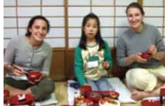
輪島塗で夕食を頂く Enjoying dinner using a "Urushi" rice bowl