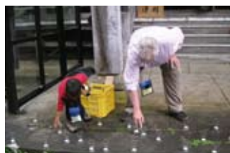
蠟燭を並べる参加者 Participants laid candles