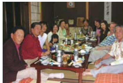
ホストファミリーと記念撮影 With a host family