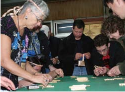
建具の構造を学ぶ Learning traditional woodworking techniques