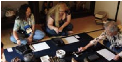
書道で漢字の意味を知る Learning calligraphy