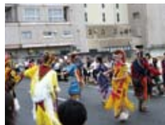
よさこい祭りでダンス披露 Performance in Yosakoi festival