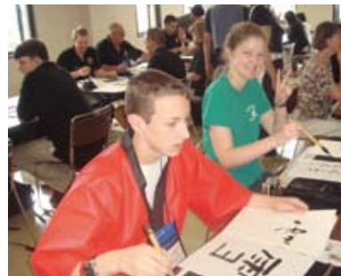
書道で漢字を勉強 Learning a Kanji letter through calligraphy