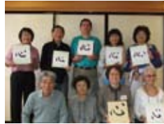
色紙を書いて記念撮影 Art works