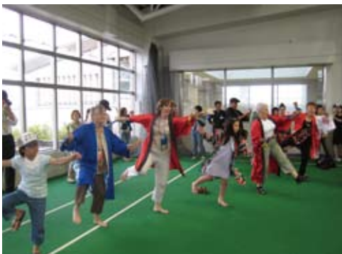
よさこいを楽しむ Enjoying Yosakoi-dance