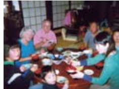
日本の朝食を堪能 Enjoying a Japanese breakfast