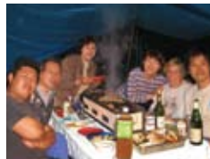
ホストファミリーとの記念写真 Dinner with a host family