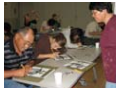
切り絵を体験 Experiencing engraving a picture