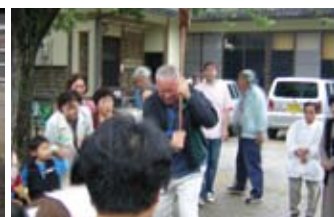
もちつきを体験 Making rice cakes