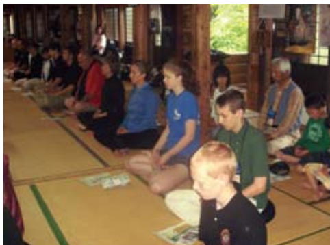
座禅をくむ参加者 Experiencing Zazen