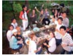
潮干狩りで穫れた海の幸で バーベキュー A barbecue party after beach net fishing