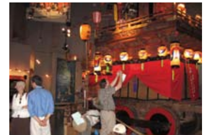
みこしを見学 Visiting a portable shrine