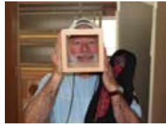
建具で記念撮影 Showing off handiwork