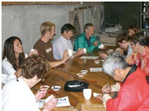
大社焼の絵付けに挑戦中 Painting on Taisha-pottery