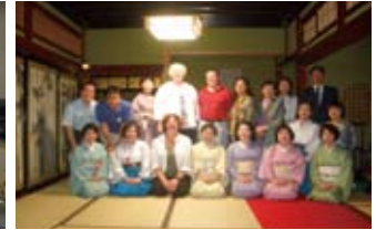
地元ボランティアとの記念写真 Posing with local volunteers