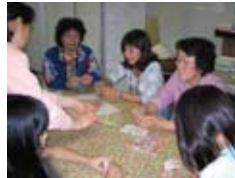
おりがみを折る Making Origami