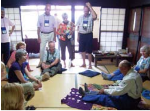
わらじ作りを体験 Making Waraji straw sandals