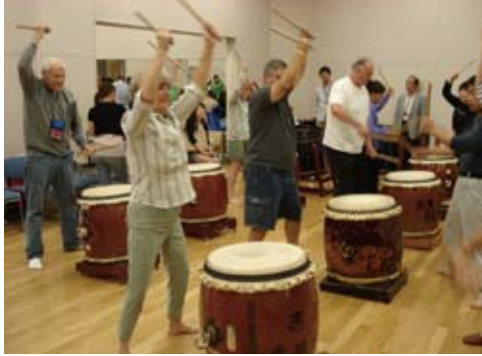
和太鼓を楽しむ Enjoying Taiko drumming