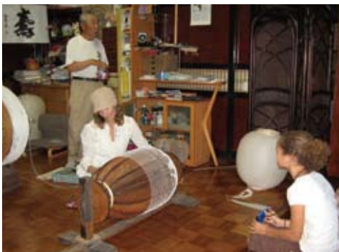
紙提灯を制作 Assembling a paper lantern