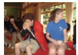
抹茶をあじわう Enjoying the tea ceremony