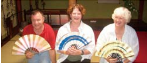
扇子をもって記念撮影 Anamizu traditional folding fans