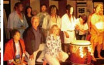
輪島の祭りに感動 Enjoying Wajima's festival