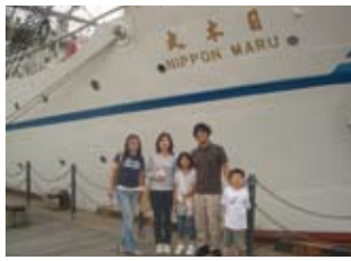
ホストファミリーとの一日 One day with a host family