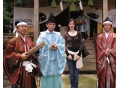
虫送り祭りが復活 Revived Mushi-okuri festival