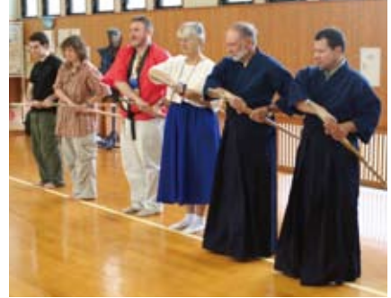
剣道に挑戦 Learning Kendo