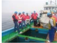
船で富山湾へ Cruising in Toyama bay