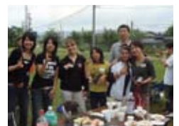
ホストファミリーとの記念写真 With a host family