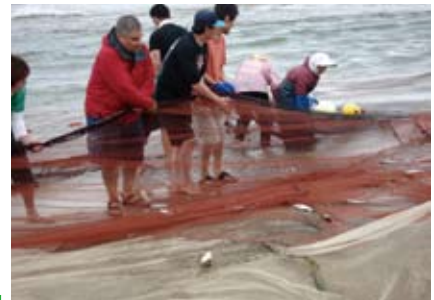
地引き網を体験 Beach net fishing