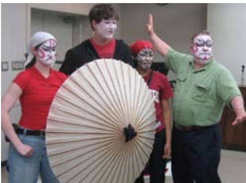
歌舞伎役者のメイクを体験 A pose after Kabuki make-up