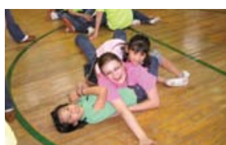
地元の子どもたちと仲よし Playing with local children