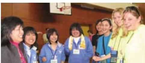
地元中学生との交流 Exchange with local students