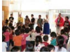
地元小学校を訪問 Visiting a local school