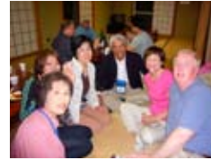
ホストファミリーとの 記念写真 New-found friends