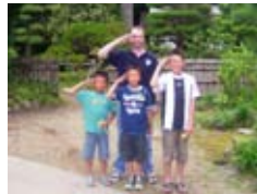
地元の子どもたち記念撮影 With local kids