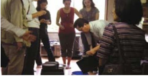
伝統的な漆塗りを見学 Visiting traditional "Urushi" lacquerware factory