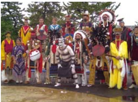
公演後の記念撮影 Posing after their performance