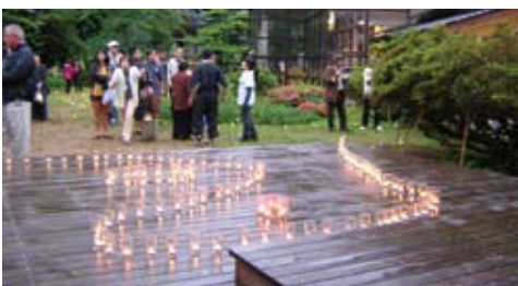
能登半島を象った万燈会が完成 Noto peninsula is depicted by candles