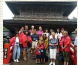
總持寺にて記念写真 With host families at Sojiji temple

Monzen Town and Wajima City, both hit hard by the Noto earthquake, joined together to host visitors. Participants experienced Zen meditation at Sojiji temple and learned about Monzen and the Noto earthquake.