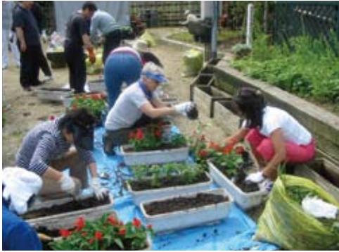
公園の整備をお手伝い Planting flowers in a local park