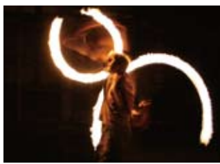
御礼のファイヤーダンス Fire dance performance