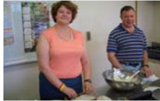
のり巻きづくりを体験 Making sushi rolls