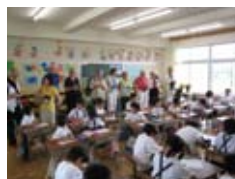
地元小学校を訪問 Visiting a local school