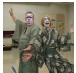
歌舞伎のメイク Kabuki make-up