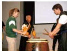
太鼓をたたく Taiko drumming