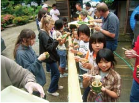
流しそうめんを堪能 Enjoying floating noodle (Nagashi-somen)