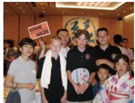
ホストファミリーと記念撮影 With a host family