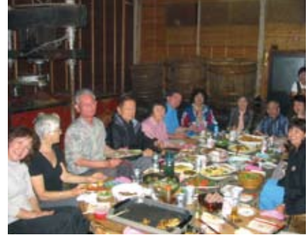
地元住民とのお食事会 Dinner in a local house