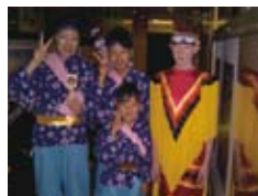
よさこいダンサーと記念撮影 With Yosakoi dancers