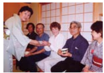
お茶会を体験 Experiencing Tea Ceremony