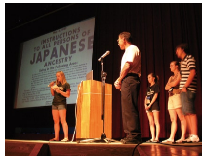
異文化ワークショップ、講演