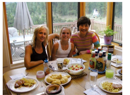
心温まるホームステイ