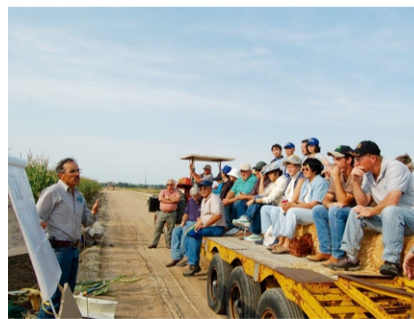
地域ボランティアによる大会運営

日米草の根交流サミット大会は1991年より始まり、2歳から93歳の年齢も性別も国籍もさまざまな約26,000名が参加しています。さまざまなイベントを通し、外国を身近に体験、理解し、また母国を紹介することで、サミット大会ならではの相互理解、国を超えた心に残る交流が生まれています。