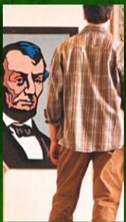
リンカーン生誕200周年祭