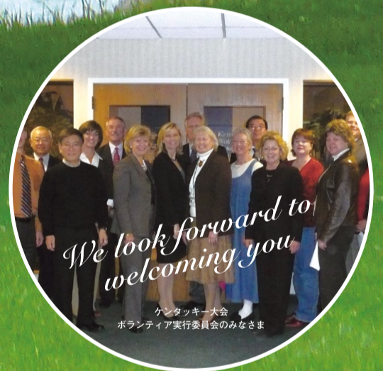
ケンタッキー大会 ボランティア実行委員会のみなさま