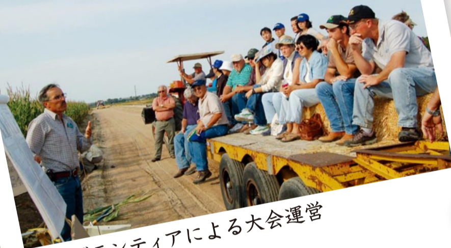
地域ボランティアによる大会運営