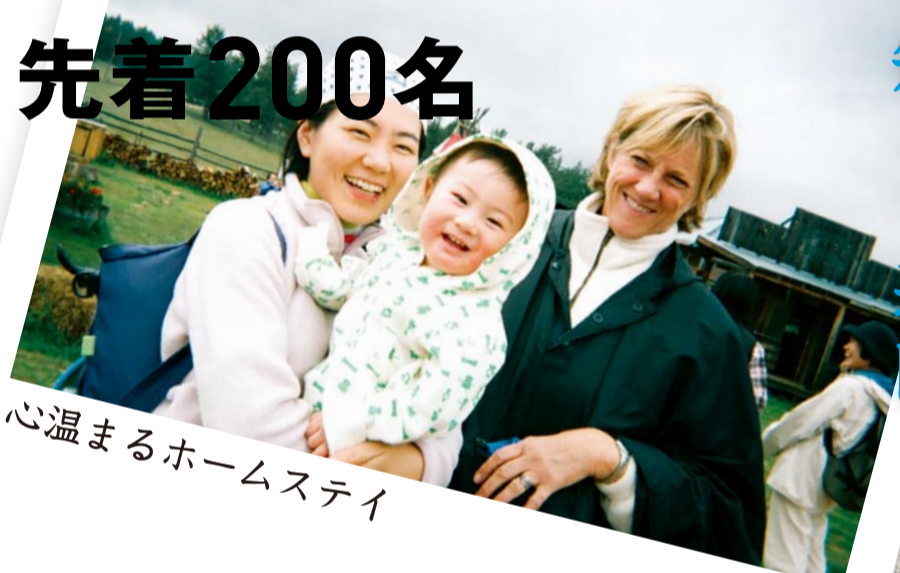
心温まるホームステイ

日米草の根交流サミット大会は1991年より始まり、2歳から93歳の年齢も性別も国籍もさまざまな約26,000名が参加しています。さまざまなイベントを通し、外国を身近に体験、理解し、また母国を紹介することで、サミット大会ならではの相互理解、国を超えた心に残る交流が生まれています。