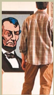
リンカーン生誕200周年祭