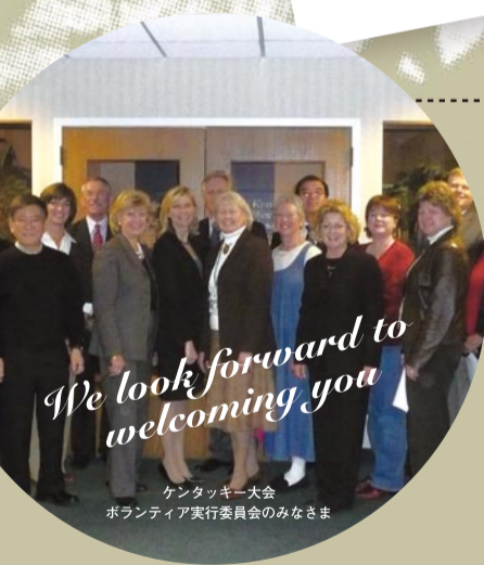
ケンタッキー大会 ボランティア実行委員会のみなさま

大会詳細 お申し込み方法は www.manjiro.or.jp へアクセス! お問い合わせ: ky@manjiro.or.jp (E-メールをお使いにならない方はFAX:03-3511-7175にてお問い合わせ下さい。)