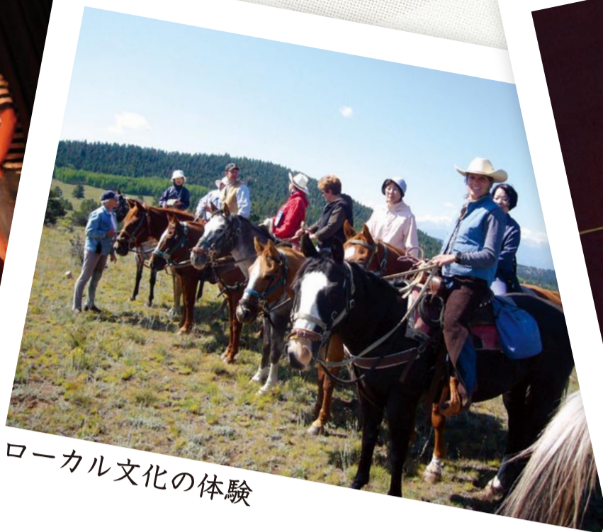
ローカル文化の体験