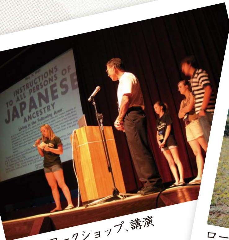
異文化ワークショップ、講演